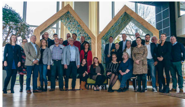
26 juni 2018: Ondertekening Woonruimteverdeelbeleid

Juni 2018 konden zowel alle corporaties als huurdersorganisaties hun handtekening onder dat beleid plaatsen. Een goed begin! Maar er moest nog veel meer gebeuren! Hoe zou het beheer ervan geregeld moeten worden en welk systeem was er voor nodig