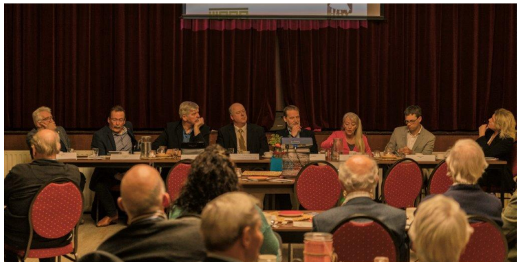
Foto: Lijsttrekkersdebat gemeente Tynaarlo